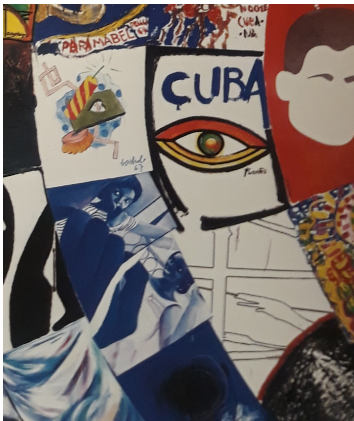
Figura 3 - Pormenor da pintura Cuba Colectiva com os fragmentos pintados por Lourdes Castro e René Bértholo. BONDIL, Nathalie. Cuba Art et Histoire de 1968 à nos jours . Montréal: Musée des beaux-arts de Montréal. 2008.

CRUZEIRO, Cristina Pratas. "A coincidência da invenção poética revolucionária com a invenção política revolucionária": os casos das obras Cuba Colectiva e 48 Artistas, 48 Anos de Fascismo .