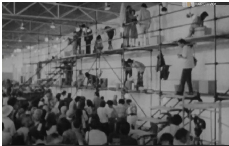
Figura 4 - Jornada de Solidariedade com o MFA, 10 Junho de 1974.

A jornada contou com diferentes intervenções nas áreas da música, artes plásticas e teatro 23 e com a participação de centenas de artistas. Esta foi uma iniciativa onde se ensaiou “um conjunto de actos (...) que propunham uma nova relação entre a arte e o público.” (VESPEIRA DE ALMEIDA, 2009, p. 113). A proximidade aconteceu em vários momentos da iniciativa, durante os momentos de pintura, música e teatro, sendo que a sua concretização contribuiu em larga medida para o ambiente de festa e de “grande alegria comunitária” (GONÇALVES, 1974, p. 40) que a Jornada representou (Figura 4).