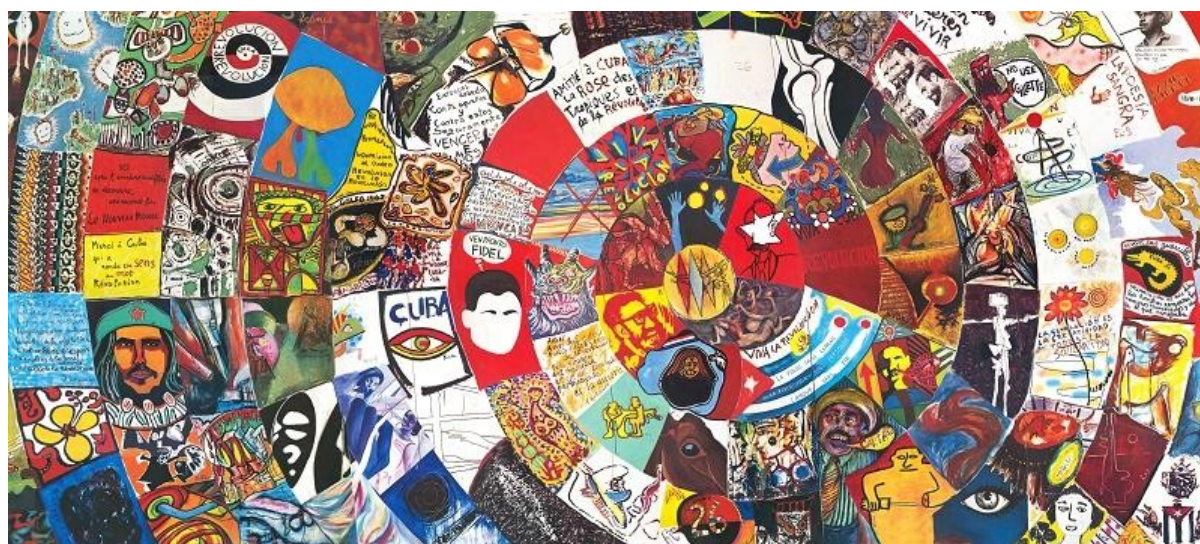
Figura 2 - Cuba Colectiva , 1967. Pintura. Disponível em: http://espina-roja.blogspot.com/2019/09/cuba-colectiva-mural-realizado-por-100.html . Acesso em: 14 jan. 2022.

estrutura em espiral (por Eduardo Arroyo e Gilles Aillaud), dividida por vários segmentos. Cada segmento foi atribuído aleatoriamente 14 a um participante, cabendo-lhe esse espaço para pintar. Embora colectiva, a pintura é a combinação das expressões individuais de cada artista, que, em raras ocasiões, procuraram fundir a sua intervenção com a dos segmentos próximos. Entre representações visuais e textuais, as referências ao contexto revolucionário são muitas, embora existam também muitos segmentos de carácter mais abstractizante. No conjunto, trata-se de uma composição heterogénea mas unificada pela estrutura em espiral. Paula Barreiro López ressalta da iniciativa a “colaboração colectiva (em termos de uma obra de arte indivisível)”, que “desafiou o elogio da (concepção burguesa de uma) produção individual do Ocidente, bem como a ortodoxia do realismo socialista da União Soviética.” (BARREIRO LÓPEZ, 2015, p. 8).