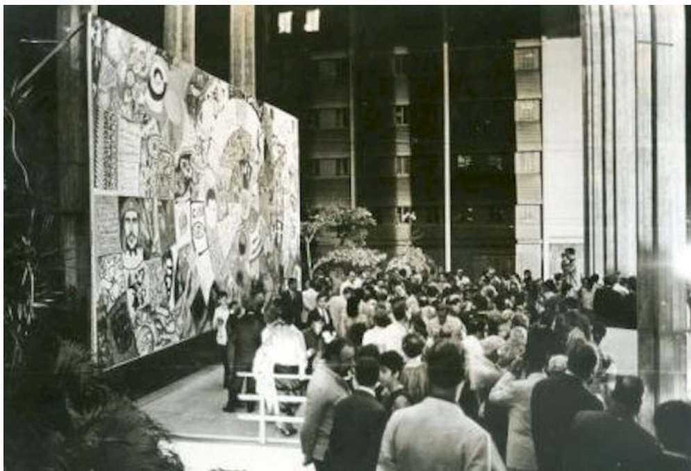
Figura 1 - Fotografia da pintura Cuba Colectiva no Salón de Mayo , 1967 (GRANMA). Disponível em: https://cubanartnewsarchive.org/2017/12/12/paris-in-havana-la-gran-espinal-celebrates-the-1967-salon-de-mayo/ . Acesso em: 14 jan. 2022.

A pintura Cuba Colectiva foi realizada entre 17 e 18 de Julho de 1967, integrada na programação do salão. A ideia de convidar vários artistas a realizar uma pintura colectiva foi novamente de Wifredo Lam (SCHÜTZ, 2008, p. 277), acabando por ser um acontecimento com grande destaque, onde largas dezenas de pessoas participaram, "manifestando o espírito comunitário da revolução." (BARREIRO LÓPEZ, 2015 p. 8). A execução da pintura foi feita ao vivo, na rua, após o discurso do Ministro dos Negócios Estrangeiros, Raul Roa, junto a uma das artérias mais movimentadas de Havana (Rampa), com cerca de 5000 pessoas a assistir e com transmissão televisiva, segundo Allain Jouffroy (1967, p. 26) (Figura 1).