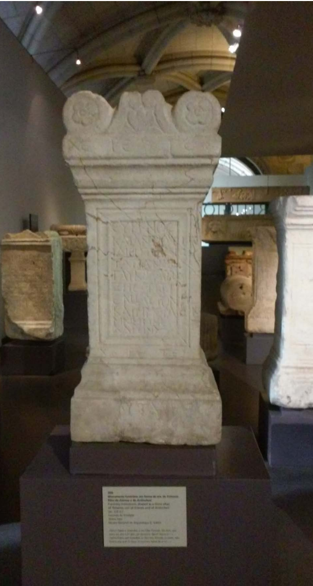
FIG. 3 Altar de época romana recolhido em 1856 na Fazenda do Trindade (Tavira) por Teixeira de Aragão, atualmente no Museu Nacional de Arqueologia © (MNA, 994.43.1).

“parte cedendo-a avulsamente, parte, e a mais importante, vendendo-a em leilão” (Vasconcelos, 1904: 135). Além da numismática e da arqueologia, onde se incluía uma coleção de anéis antigos (Aragão, 1887), Teixeira de Aragão colecionou