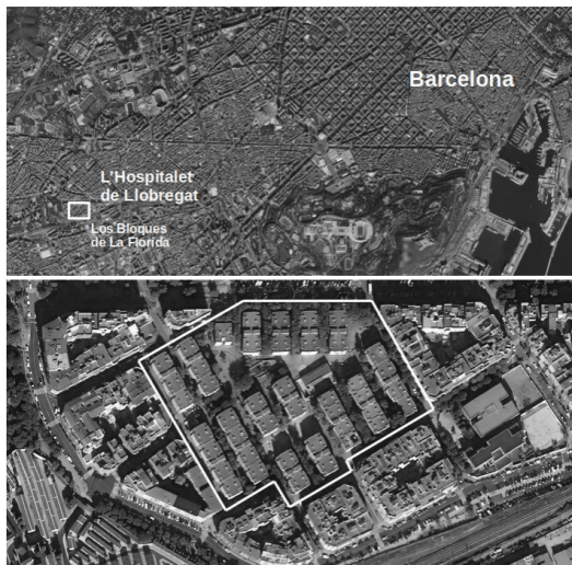
Figura 1. Localización de Los Bloques de La Florida, en el municipio de L'Hospitalet de Llobregat.

se atenderá también al conjunto de políticas públicas – escasas – que fueron inicialmente orientadas a mejorar las condiciones de vida y la convivencia en el barrio, pero que fracasaron y condujeron posteriormente a una ghetización institucionalizada llevada a cabo por las más recientes políticas de regeneración urbana (de carácter simbólico) y de intervención comunitaria. Posteriormente, el artículo prestará atención a la eclosión del Spanish Drill – un subgénero específico de música trap – como una respuesta colectiva de contestación juvenil no-violenta contra la marginalidad racializada (Vincze, 2013; Wacquant, 2015; Marinaro, 2019) a la que son sometidos cotidianamente las y los jóvenes del barrio. Para ello, el artículo focalizará su análisis en el caso de Morad, exponente más visible y mediatizado de Los Bloques y cuya obra musical constituye una descripción de la topografía social cotidiana del barrio que es sistemáticamente desoída por el llamado frente mediático-institucional-civil – en terminología de Aramayona y Nofre (2021). Es por ello que, a modo de homenaje al The Detroit Geographical Expedition and Institute de William Wheeler Bunge Jr. y Gwendolyn Warren, el artículo finalizará presentando los motivos por los cuales Los Bloques de La Florida constituyen aun hoy en día una terra incognita con enorme interés para la geografía social militante y combativa.