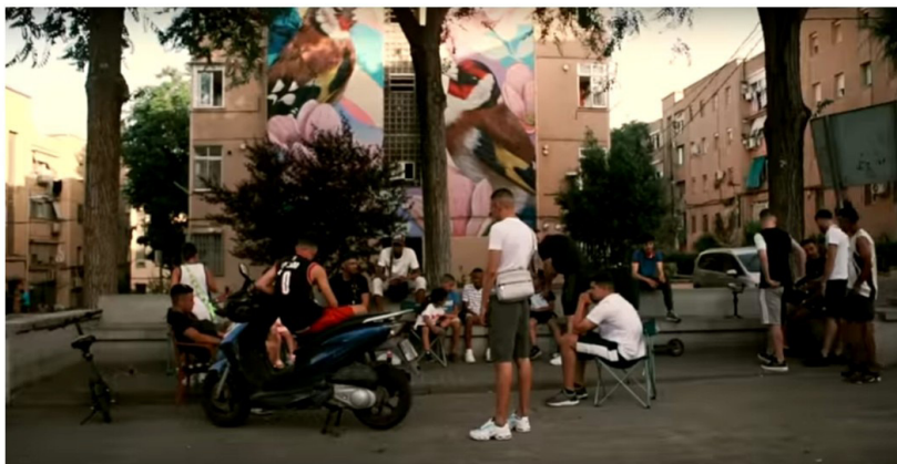
Figura 3. Pictograma del videoclip oficial de “Necesario”, de Morad (2021).

«Pero e' lo que hay, vivo con prejuicios A veces en concierto', a veces en los juicios» (Morad, Paranoia freestyle , 2021).