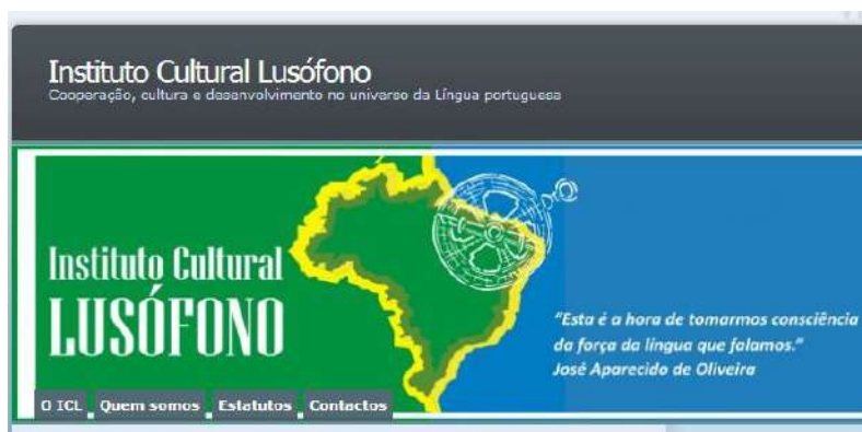
Figura 2: Instituto Cultural Lusófono

peças ligadas a diferentes áreas da cultura, da informação, do turismo e da educação unidas em torno de um propósito comum de reforço dos intercâmbios e da cooperação, sociocultural entre o Brasil e os restantes países de língua portuguesa no mundo, bem como da difusão e valorização da diversidade cultural e das identidades dos povos do universo lusófono 10 .