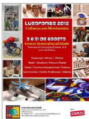
Figura 1: Lusofonias 2012. Culturas em Movimento

em Lisboa, um lugar descrito como uma “zona da cidade com profundas ligações à história das diásporas lusófonas em Lisboa e em Portugal” 5 . Aí, junto ao Espaço Santa Catarina, sede da Junta de Freguesia, o Centro InterculturaCidade também serve de palco para diversas apresentações culturais e convívios locais.