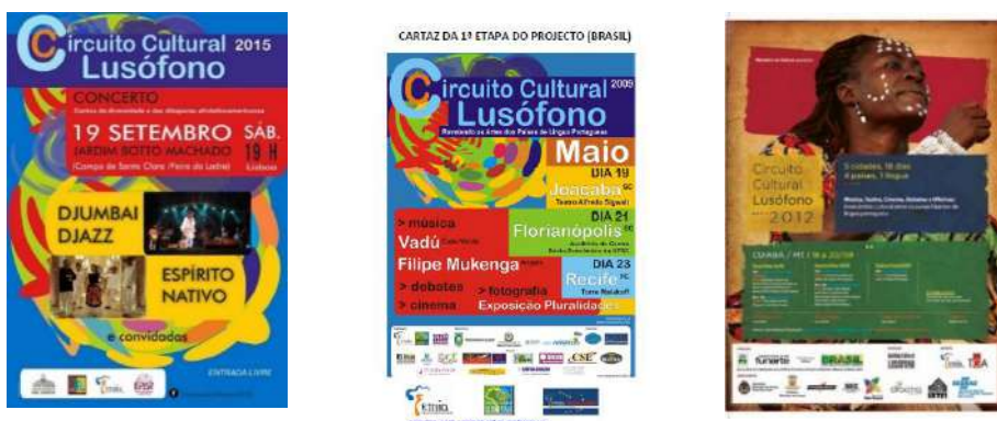
Figura 4: Circuito Cultural Lusófono em 2009, 2012, e 2015