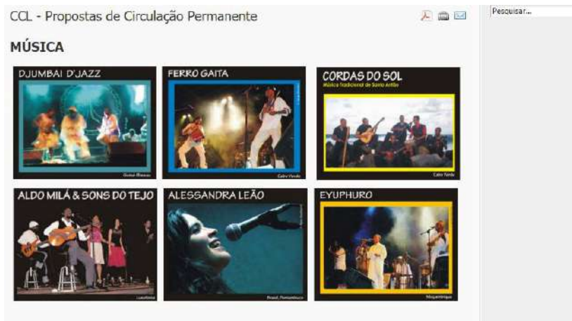
Figura 5: Proposta de circulação permanente de músicos