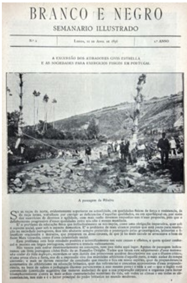
Figura 3 Capa do segundo número da Branco e Negro .