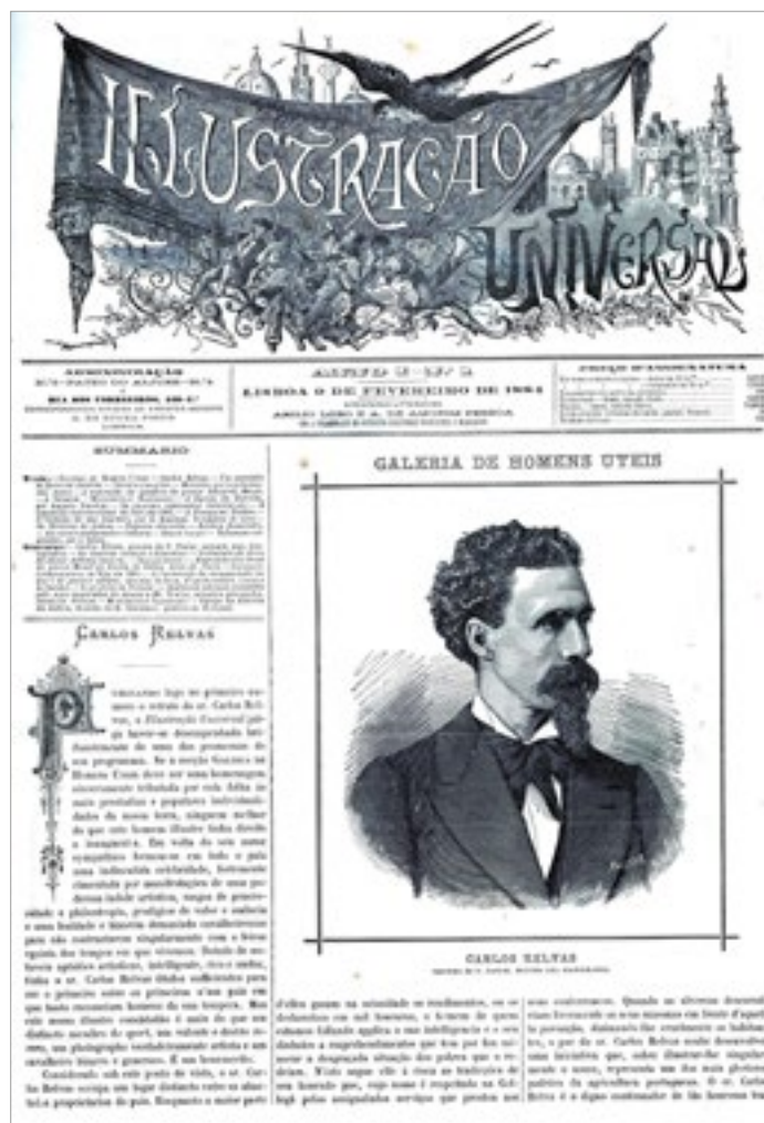
Figura 2 Capa do primeiro número da revista Ilustração Universal .

O primeiro número da Ilustração Universal revela a ambição informativa e noticiosa da revista, que concorria diretamente com O Ocidente e com a primeira revista intitulada Ilustração Portuguesa .