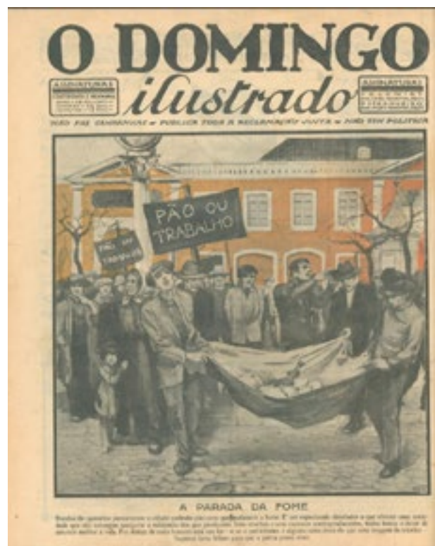
Figuras 10 e 11 Capa e contracapa do primeiro número de O Domingo Ilustrado