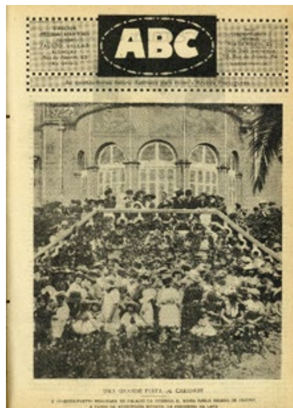
Figuras 8 e 9 Capa e capa interior da edição gratuita da revista ABC