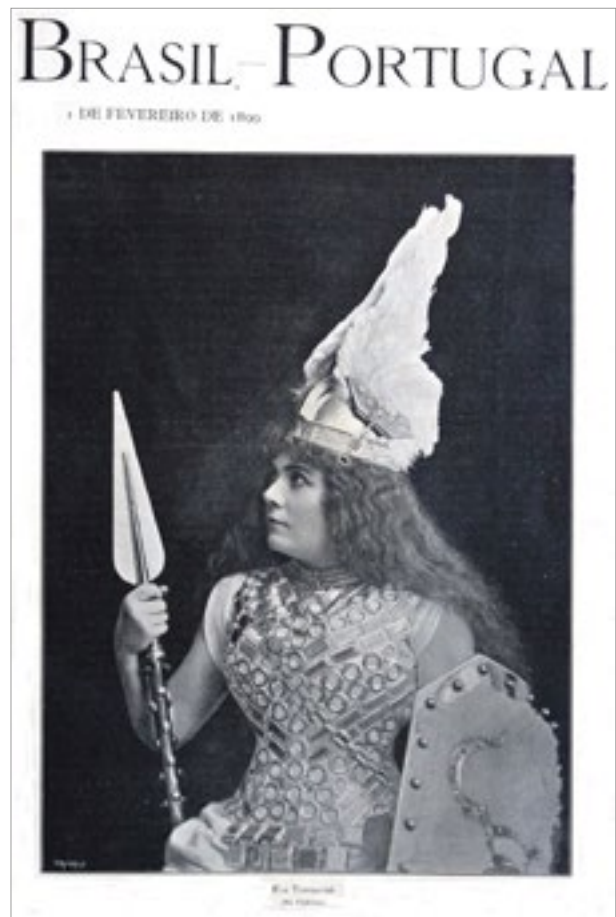
Figura 4 Capa do primeiro número da revista Brasil-Portugal.