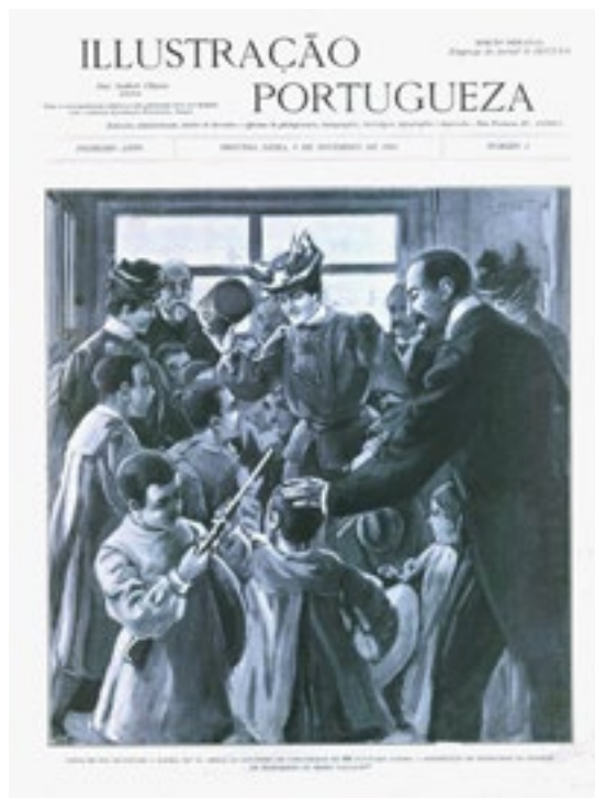
Figura 5 Capa do primeiro número da Ilustração Portuguesa