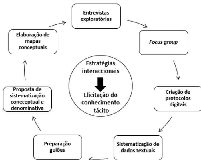
Figura 2: Estratégias interacionais de elicitação do conhecimento tácito.

As reflexões decorrentes da nossa experiência de trabalho com especialistas revelam alguns aspectos metodológicos que devem ser tidos em consideração. Um ponto fundamental será o cuidado de elaboração prévia de trabalho preparatório, como a realização de entrevistas exploratórias, a análise de textos para fins onomasiológicos e a de sistematização conceptual e denominativa. É certo que a qualidade das conceptualizações obtidas dependerá em grande escala do consenso já estabelecido entre comunidades, mas dependerá igualmente da criação de guiões e protocolos dialogais e da selecção de métodos e técnicas adequados ao produto terminológico que se pretende obter (Roche et al , 2009, p. 5):