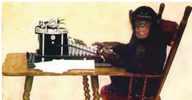
Figura 1: Um macaco dactilógrafo: quanto tempo será necessário para escrever Hamlet ? Será mais rápido evoluir até o bardo ou continuar a bater as calhas?

O primeiro de todos é a ideia de que o processo evolutivo é sequencial: primeiro construímos pernas; depois de elas estarem prontas, vamos ver o que podemos fazer com os braços. Somente depois disto tudo poderíamos preocupar-nos com a evolução dos dedos. Na verdade, tudo evolui junto: à medida que ganhávamos a postura ereta, perdíamos pelo, desenvolvíamos uma mão mais adequada a novas tarefas e um cérebro capaz de as executar. Do ponto de vista fundamental, a evolução de cada gene depende de todos os outros (o que, diga-se, dificulta muito a descrição matemática da evolução) e quando uma variante se impõe (ou seja, está pre-