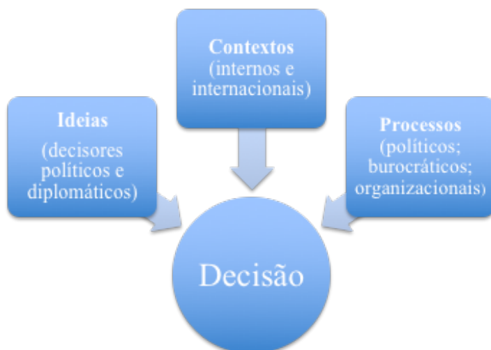
Imagem 1 - Visão subjetiva, contextual e processual da abordagem fenomenológica da APE