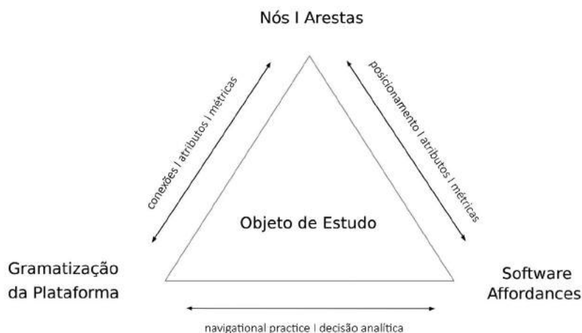
FIGURA 1 – Processo de análise de redes digitais: o que se deve ter em conta?