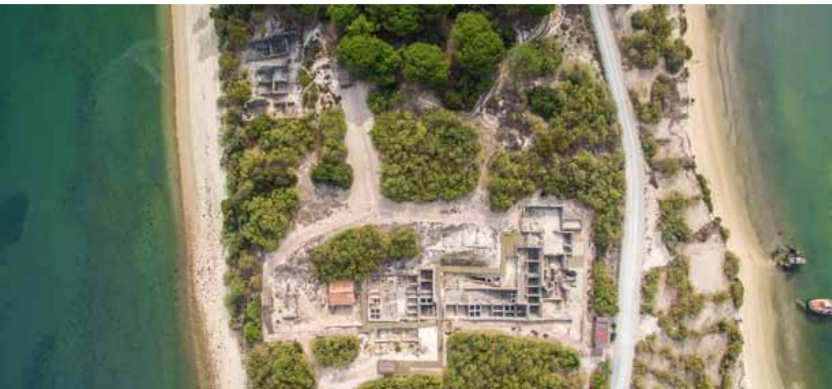
Figura 2: Circuito de visita aberto ao público.

O percurso de visita inaugurado em 2011 convida o visitante a recuar até ao séc. I d.C. e a conhecer um monumento nacional que sobreviveu mais de 2000 anos, com casas, fábricas, termas, mausoléu e necrópole, que identificam a civilização romana. [Figura 2]