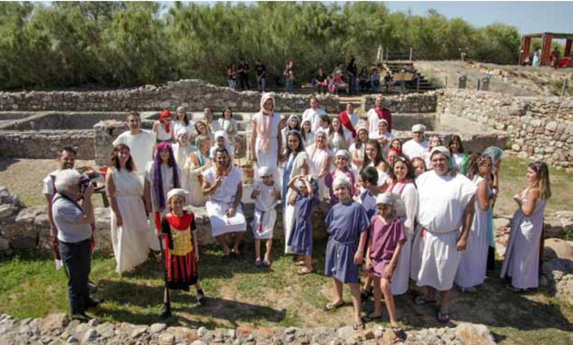
Figura 6: “Teatro da Vila”, grupo de teatro amador de Palmela, na recriação histórica das salgas e molhos de peixe do evento Mercado Romano 2017.

A identificação dos valores do sítio permite uma aproximação com as comunidades que valorizam este património e qual o significado que esta herança tem para essas populações. Por seu lado, a fruição turística do sítio e o desenvolvimento da animação cultural tem como objetivo o envolvimento e aumento de diferentes públicos.