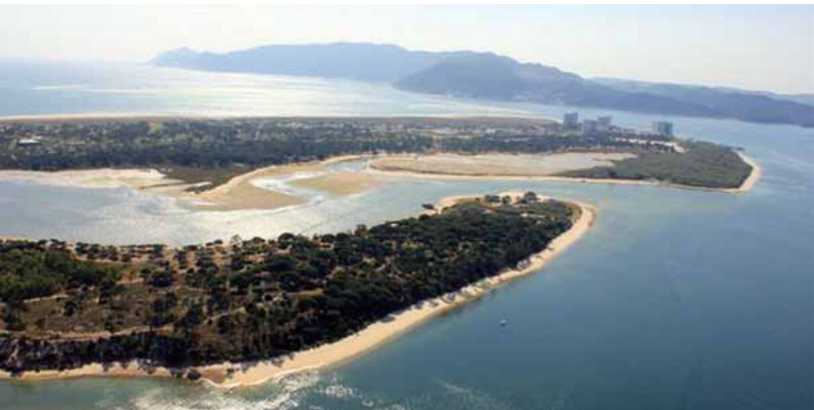
Figura 1: Vista aérea do sítio arqueológico de Troia e do Troiaresort.

As Ruínas Romanas de Troia situam-se na atual península de Troia, freguesia do Carvalhal, concelho de Grândola e distrito de Setúbal e integram a Rede Natura 2000 (Sítio PTCON0011- Estuário do Sado). [Figura 1] Este sítio arqueológico com c. de 2 km de extensão foi classificado em 1910 como Monumento Nacional (Decreto de 16 de Junho) com Zona Especial