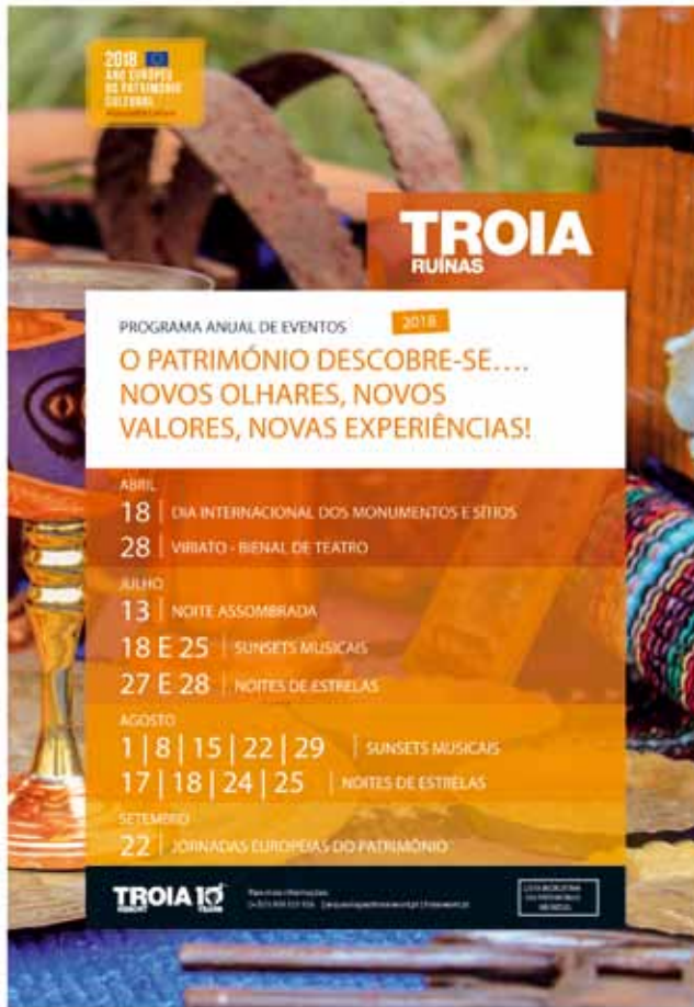
Figura 5: Programação de eventos em 2018.

visível no aumento do tráfego marítimo na Atlantic Ferries ou consumo em restaurantes e lojas do resort em dias de eventos nas Ruínas Romanas de Troia.